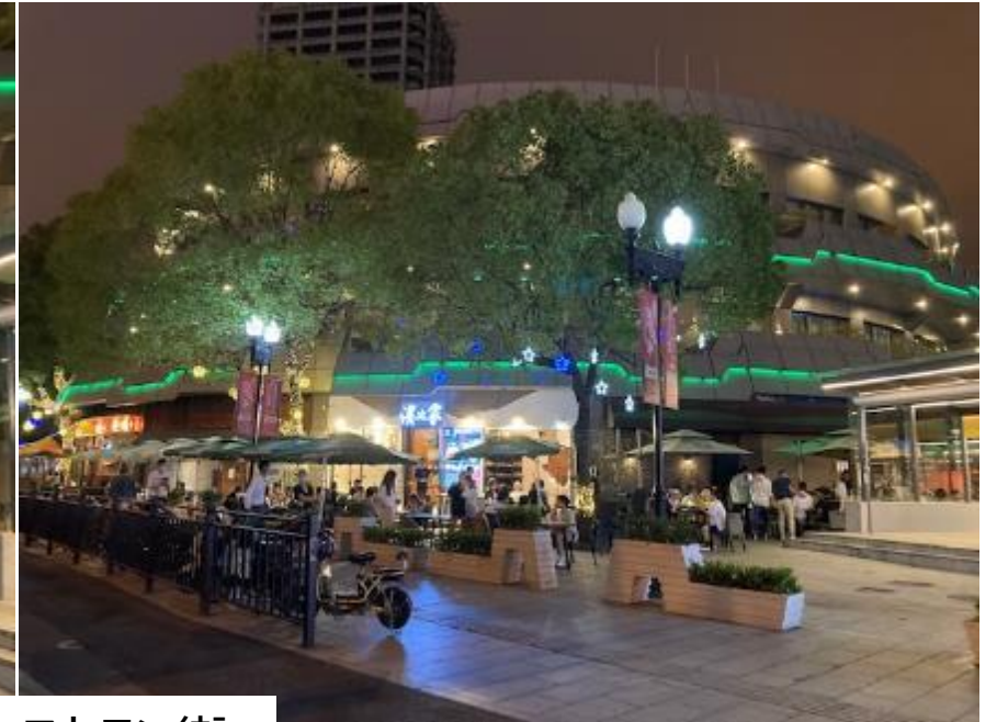
6月4日レストラン街